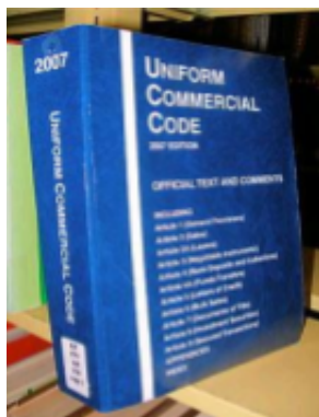
Código Uniforme de Comercio U.S.

Un poco de historia... El Código Uniforme de Comercio (UCC) fue publicado por primera vez en 1952 para armonizar la ley de las ventas y otras transacciones comerciales a través de USA, así como desalentar activamente el uso de las formalidades legales en la forma de contratos comerciales, para permitir a las empresas avanzar sin la intervención de los abogados o de la preparación de los documentos elaborados.